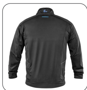
vista posteriore back side