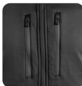
doppia tasca petto con zip chest zippered pockets